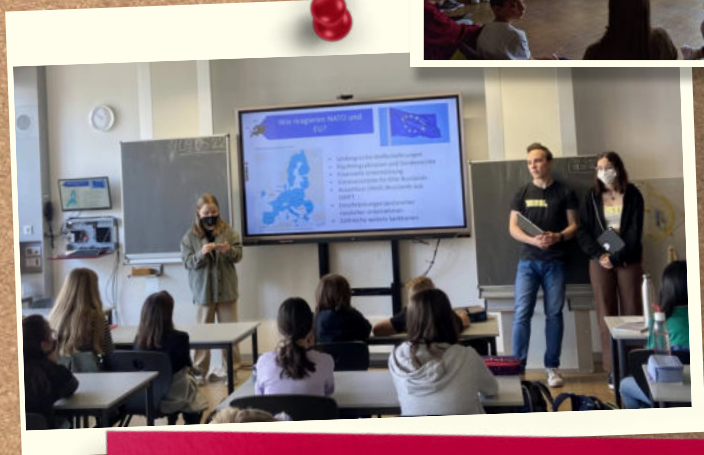
EU-Projekttag zum Krieg in der Ukraine mit der 6. Klasse, 9. Mai 2022