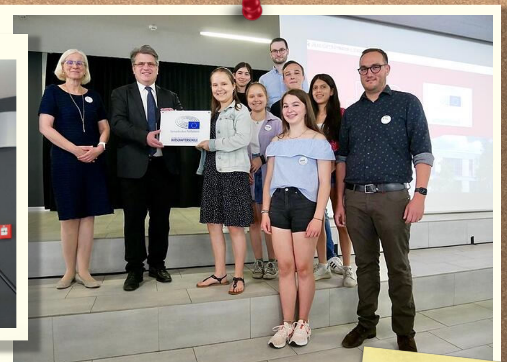
Staatsminister a. D. Prof. Dr. Winfried Bausback MdL (CSU) überreicht unseren Juniorbotschafterinnen und -botschaftern in einer Feierstunde die Plakette