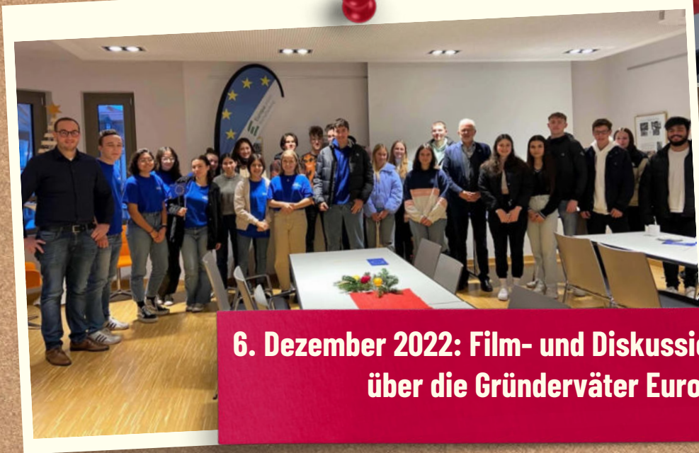
6. Dezember 2022: Film- und Diskussionsnachmittag über die Gründerväter Europas